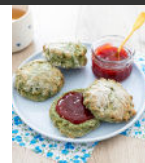
Scones banane spiruline p23