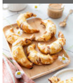
Mini croissants fourrés p14