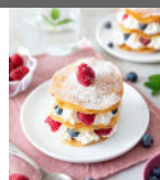
Mille-feuilles chantilly fruits rouges p11