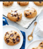
Cookies santé à la farine de lupin p19