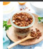
Granola quinoa p17