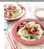
Risotto d'orge façon carbonara p6