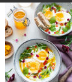
Yaourt, œufs mollets p21