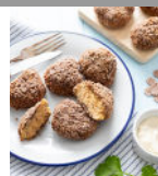
Nuggets veggie croustillants p24