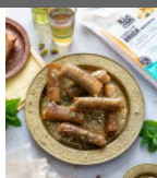
Cigares pistaches citron p11