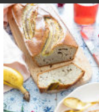
Banana bread sans gluten p16