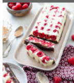
Tablette franui p14