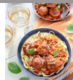
Polpette veggie à la tomate p8