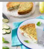
Frittata courgettes tomates séchées p7