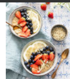
Overnight pudding au chanvre p18