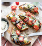
Bruschetta aubergine alla parmigiana p28