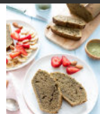
Cake au thé vert matcha p20