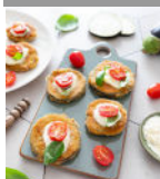
Aubergines panées tomates mozza p9