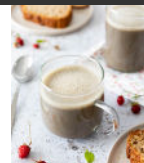
Hojicha latte p22