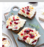
Bruschetta confiture de cerise tomate de brebis p29