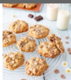
Cookies chocolate pistache p24