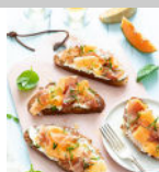
Bruschetta melon jambon de Parme p27