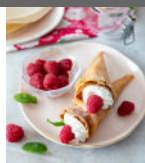
Cornets brick chantilly framboises p11