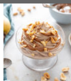
Sundae à la cacahuète p4