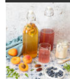
Kéfir de fruits p33